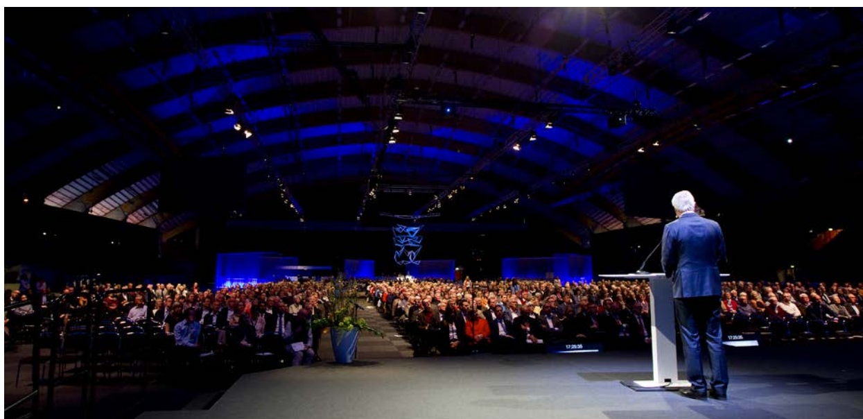
Sandviks årsstämma 2017 i Göransson Arena, Sandviken.